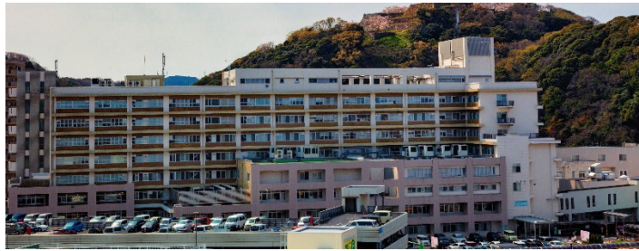
写真 鳥取大学医学部附属病院 第二中央診療棟

( https://goo.gl/maps/kg5q43XMJCKMQCDC6 )