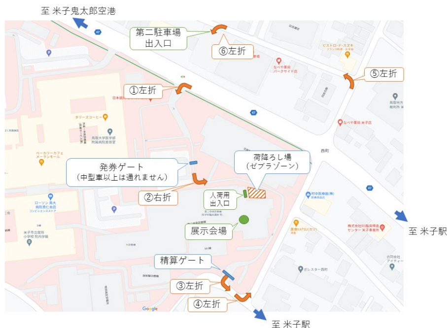
搬入経路と第2駐車場の案内